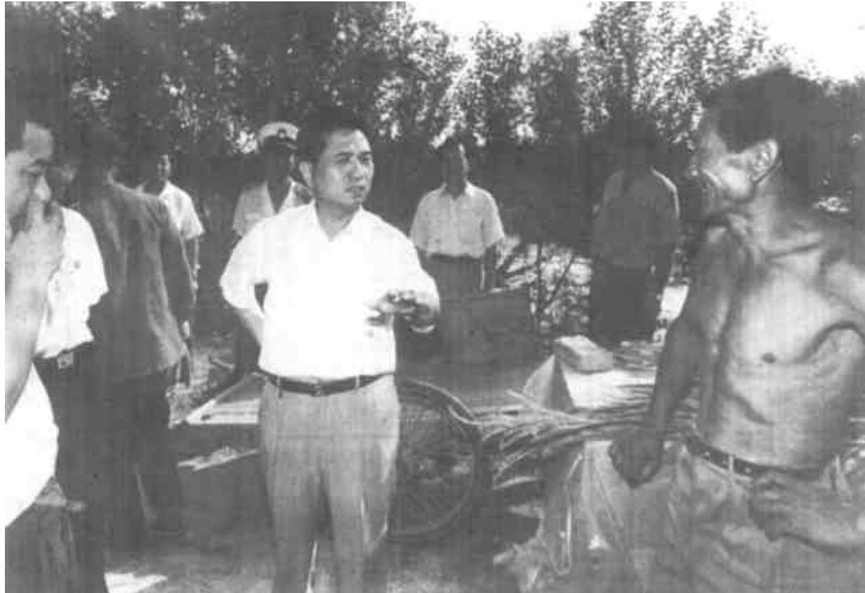
8月21日，市委书记国家森等市领导到利津县南宋乡乘船慰问被洪水围困的受灾群众。(本报记者 黄利平 摄)

本报讯 8月21日，市委书记国家森，市委副书记张万湖，市委常委、宣传部长卢得志，副市长李吉祥、滕化迎，市政协副主席刘杏元，带领民政、水利、卫生、农业、教育等部门的同志，带着面粉、药品、物资等慰问品，赶到利津县南宋乡被洪水围困的九个村庄，亲切慰问受灾群众。