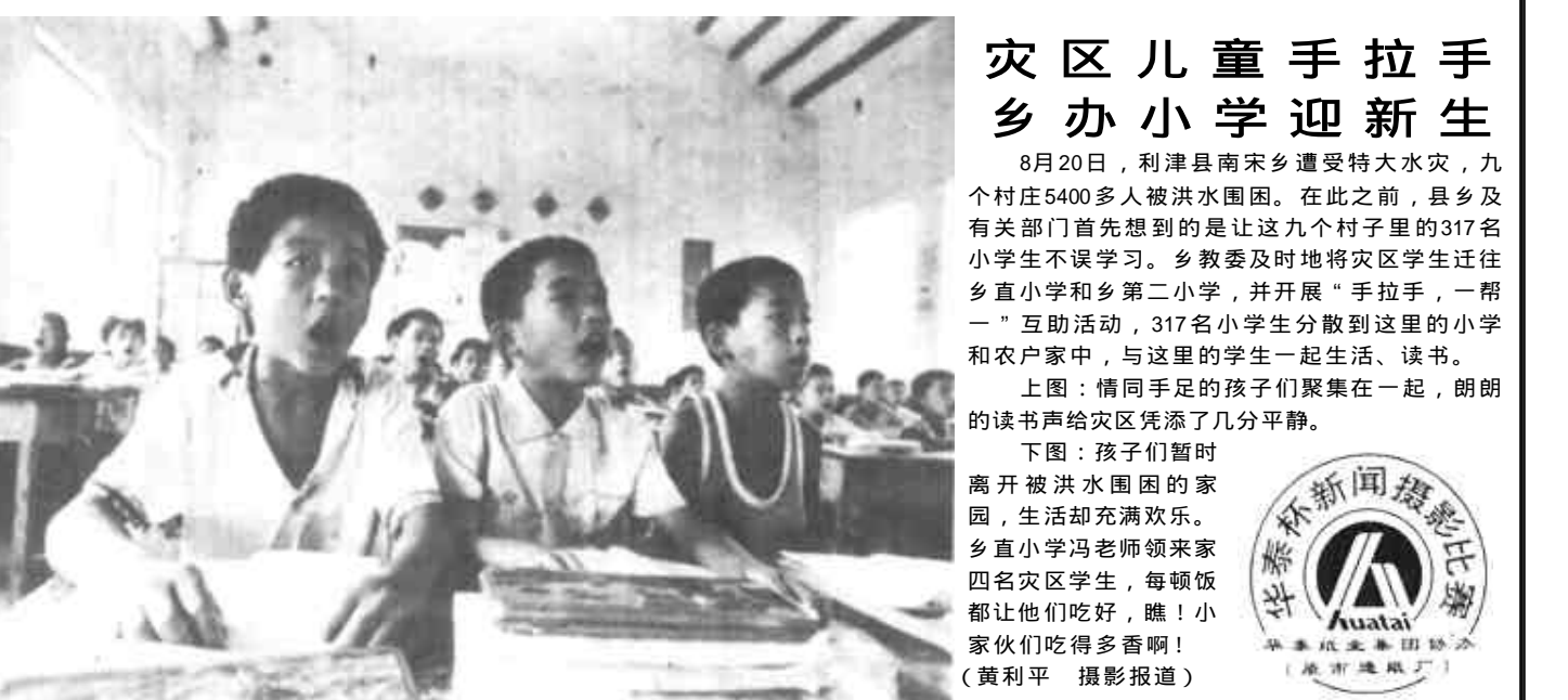
灾区儿童手拉手 乡办小学迎新生

8月22日，一号洪峰越过崔庄。3天3夜的奋战，在洪水漫过坝顶的石坝上，同步升起一道崭新的防线。