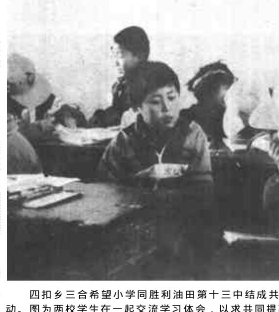
四扣乡三合希望小学同胜利油田第十三中结成共建对子后, 经常在一起开展各种活动。图为两校学生在一起交流学习体会, 以求共同提高。(张明海)